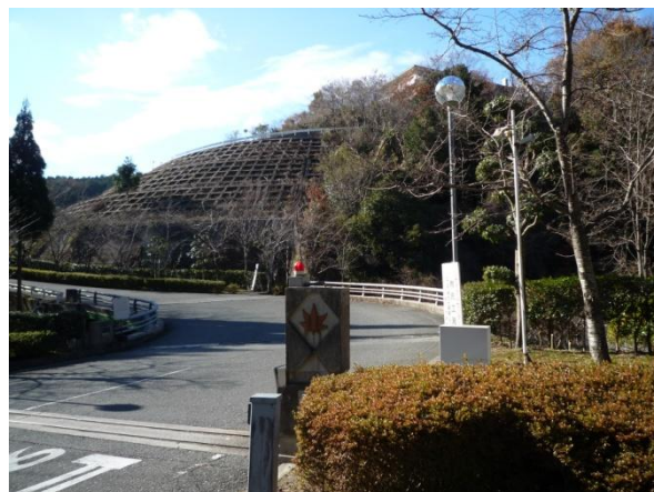
箕面市環境クリーンセンター