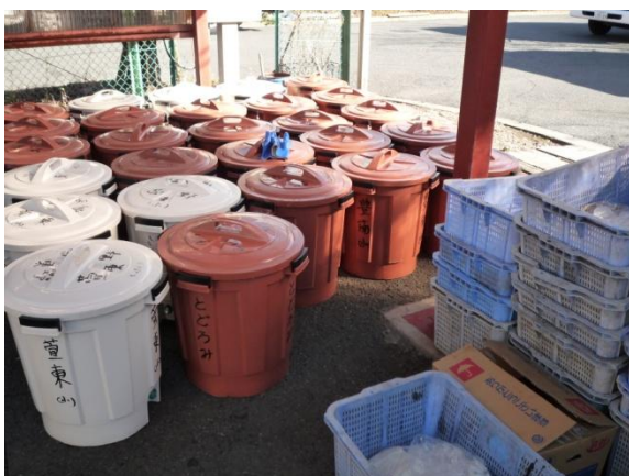
回収された給食残渣